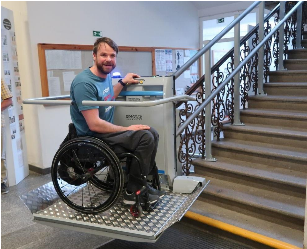
25. 10. 2016 Bezbariérová rampa