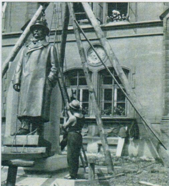
Instalace sochy T. G. Masaryka v červnu roku 1930.

ku a nová již postavena nebyla. Iniciativa však již vznikla před deseti lety. Na sociální síti v době, kdy jsme si připomínali vznik republiky, proběhla na facebookových