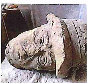
Legionářova hlava před restaurováním a po něm.